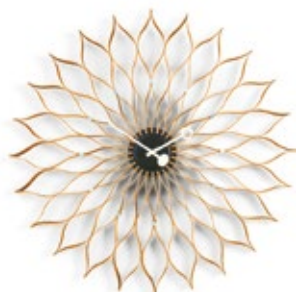
Sunflower Clock, abedul, Ø 750