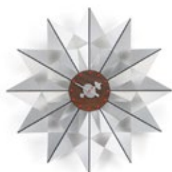
Flock of Butterflies, aluminio, Ø 610