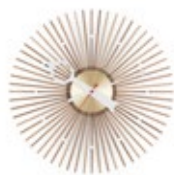
Popsicle Clock, nogal, Ø 350