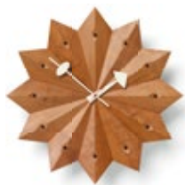
Fan Clock, cerezo (EE.UU.), Ø 384