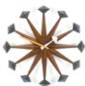
Polygon Clock, nogal, Ø 430