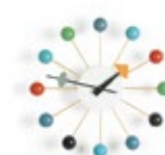
Ball Clock, de varios colores, Ø 330