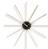
Star Clock, cromo/latón, Ø 610