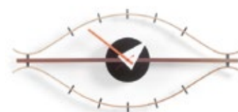
Eye Clock, latón/nogal, AL 340 x A 760